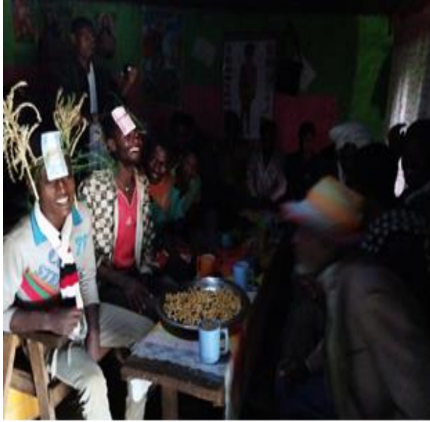
Aanaa Jimmaa Gannatiitti

Jimmaa Gannatii garee lama kan qabu yoo ta'u garee tokko nama torba, gareen lammataa nama saddeet irratti hirmaate.